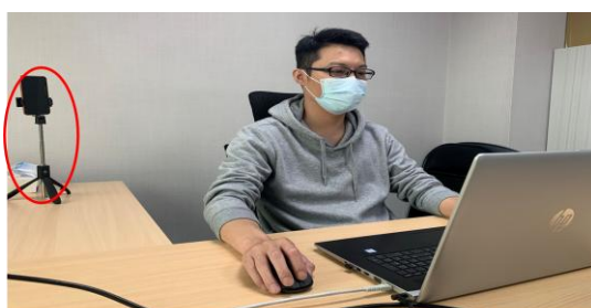
測驗期間需全程開啟視訊及麥克風，並將把手機放置於您坐定的座位斜後方的平台四點鐘或八點鐘方向